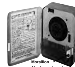
Morillon Ajuster au besoin

AJUSTEMENT DU MORAILLON: À l'aide de pinces, faire pivoter le morillon sur le côté du coffret vers le haut, comme le montre l'illustration. Fermer la porte pour vérifier si le trou du couvercle coïncide avec celui du morillon. A besoin, ajuster.