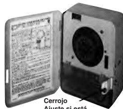
Cerrojo Ajuste si está requerido

AJUSTE DE LA ALDABA: Sostenga la sección curva de la aldaba localizada a un costado del contenedor con la ayuda de unas pinzas y gírela hacia arriba como se muestra. Cierre el contenedor a fin de verificar que el orificio de la cubierta esté bien alineado. Ajustelo si es necesario.