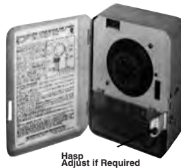
Hasp Adjust if Required

HASP ADJUSTMENT: Using pliers, grip folded down hasp on side of case and rotate it upward as shown. Close cover to make sure the hole in cover lines up. Adjust, if required.